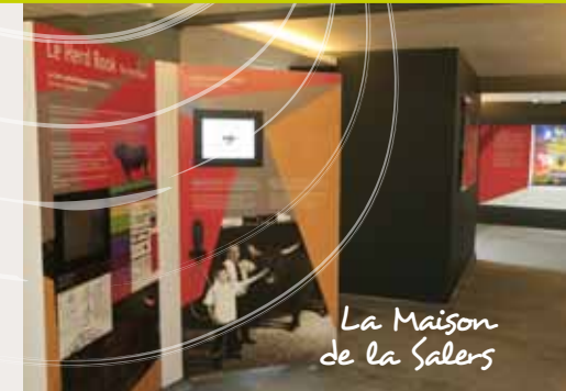
La Maison de la Salers